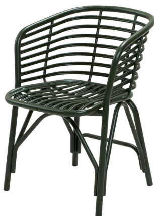
ADG Dark green