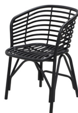
AL Lava grey