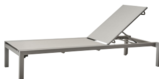
TXL Light grey